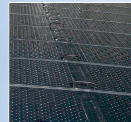
Kovová hadice APSOfuid® ASSIWELL®: Spojovací prvek mezi dvěma kolektory