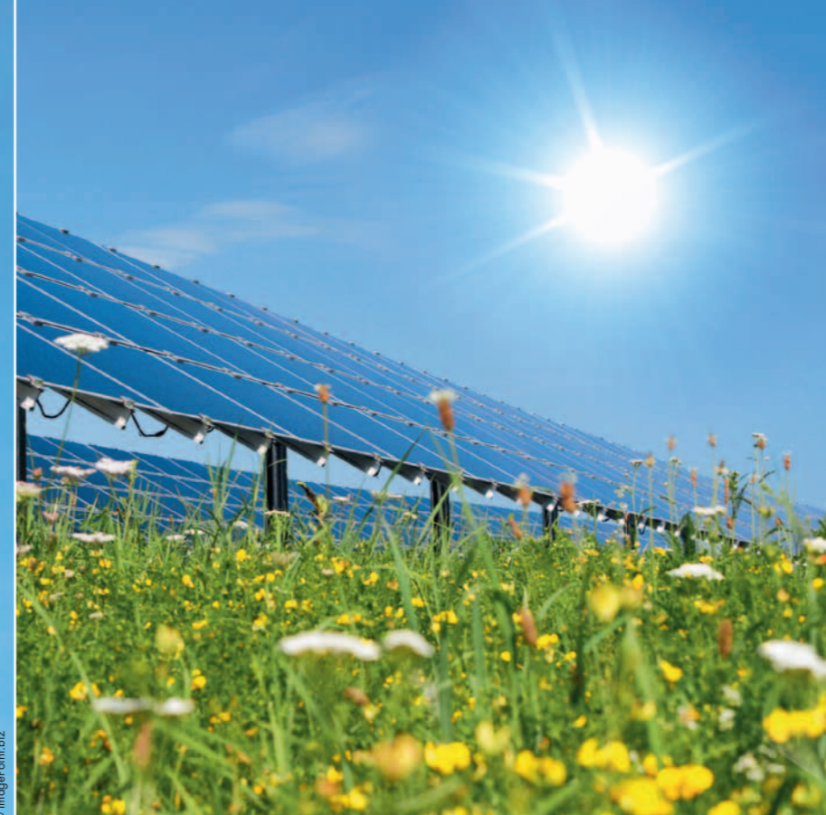
V dobách stále se snižujících zásob surovin sází firma Angst+Pfister na bezmála nekonečný zdroj: sluneční energii.