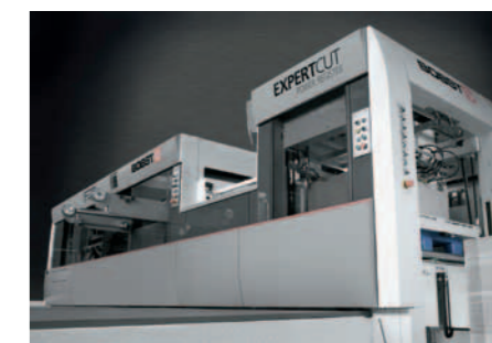
Nella fustellatrice EXPERTCUT 106 della Bobst viene impiegato l'attuatore lineare Econom della Angst+Pfister ed è garantita l'attività ininterrotta della macchina.