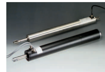
L'attuatore lineare Econom elettrico è compatto, non ha bisogno di manutenzione e rende possibile un movimento continuo come pure il mantenimento del posizionamento desiderato.

L'attuatore lineare con stelo Elero si distingue per il suo alto grado di flessibilità nell'impiego, per cui è possibile sostituire i cilindri sollevatori pneumatici e idraulici con l'attuatore lineare elettrico.