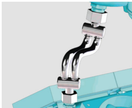
Der Schlauch ist Standard, die Armaturen sind speziell entwickelt.