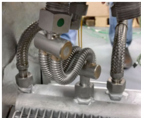
ASSIWELL® Ganzmetallschlauch: robust und doch extrem biegsam.

führend sind. Frühmorgens schon werden die Servierwagen zum Verteilen des Frühstücks bereitstehen, und sie werden unermüdlich und unerschöpflich den ganzen Tag weitermachen, bis auch das Abendessen in der gewünschten Temperatur serviert ist.