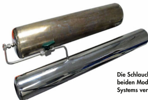
Die Schlauchleitungen werden die beiden Module des thermochemischen Systems verbinden.