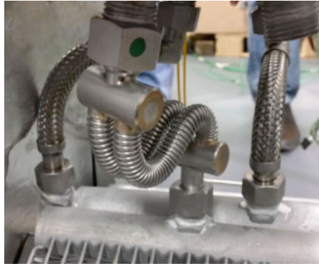
Tubo flessibile metallico ASSIWELL®: robusto e al contempo estremamente flessibile.

buon'ora per distribuire la colazione e resteranno «instancabilmente» in servizio per tutto il resto della giornata fino a quando, all'ora di cena, non sarà servito anche l'ultimo pasto alla temperatura desiderata.