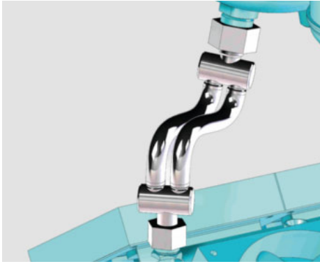
Il tubo flessibile è standard, i raccordi sono personalizzati.