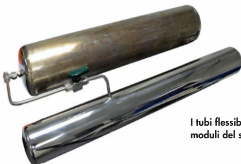
I tubi flessibili collegheranno i due moduli del sistema termochimico.